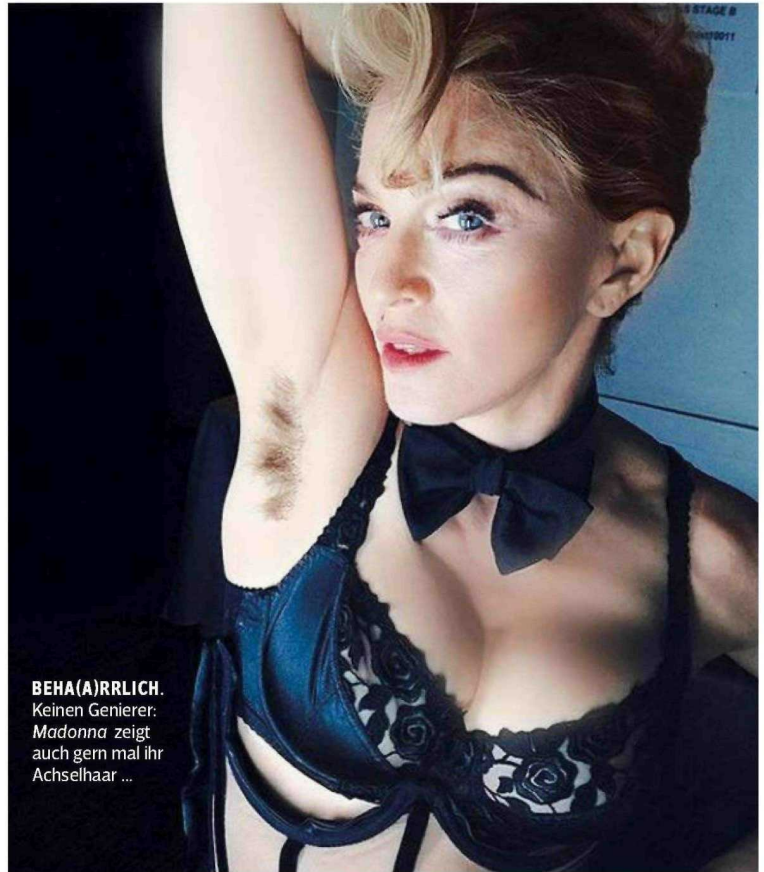
BEHA(A)RRLICH. Keinen Genierer: Madonna zeigt auch gern mal ihr Achselhaar ...